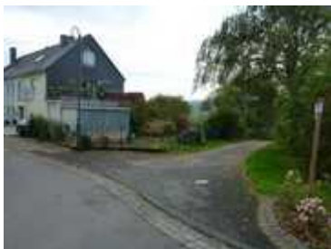
M1 Blick in Laufrichtung

M3: In Laufrichtung sollte zur Sicherheit ein ↗ Pfeil ergänzt werden.