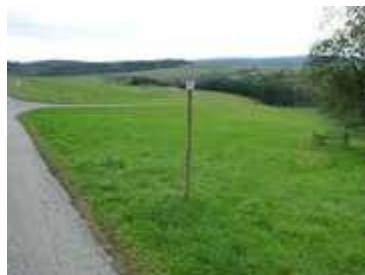
M2 Blick in Laufrichtung