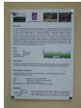
Infotafel am Startpunkt der Tour