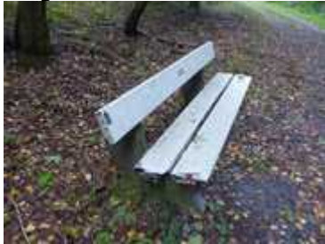
Km 12: Lageplan Bank 1

Auf dem letzten Kilometer stehen zwei unattraktive Bänke, die gelegentlich erneuert bzw. ausgetauscht werden könnten (siehe Lageplan).