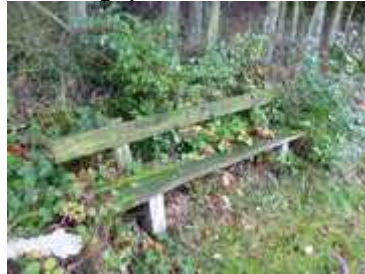
Km 12: Lageplan Bank 2

In der Traumschleifen-Broschüre wird die Länge des Zuwegs vom Parkplatz am Bürgerhaus zum Startpunkt der Tour am Kirchturm in der Ortsmitte mit 200m angegeben, tatsächlich sind es aber 500m!